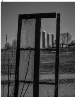
1er prix René Lapointe