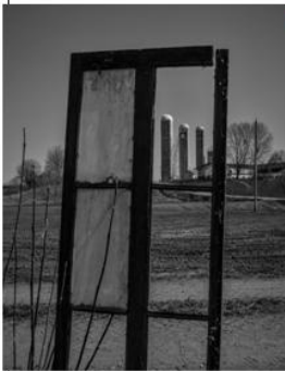
1er prix René Lapointe